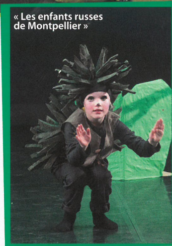
« Les enfants russes de Montpellier »