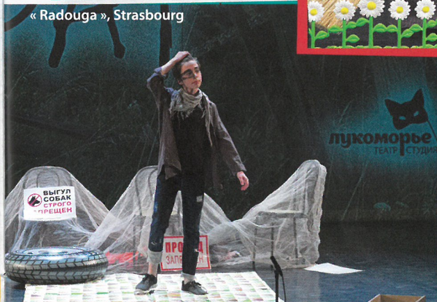
« Radouga », Strasbourg