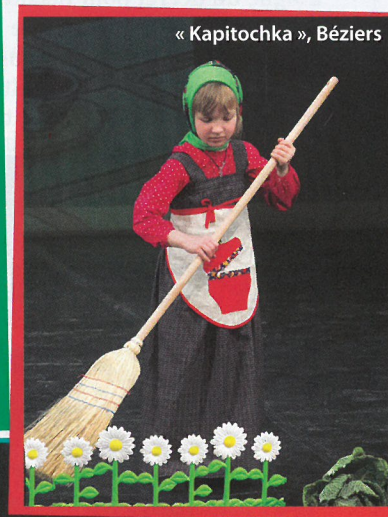
« Kapitochka », Béziers