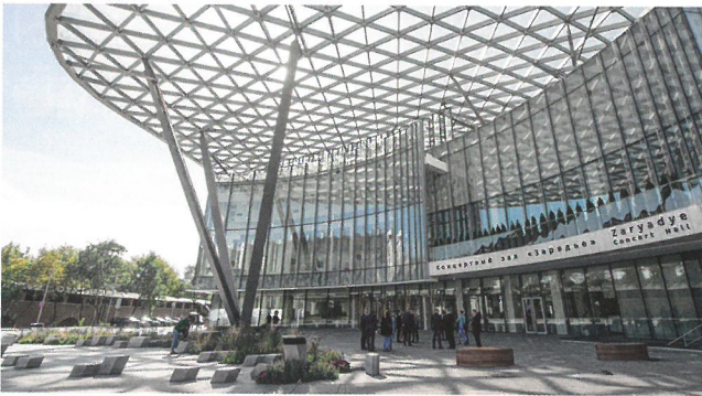
« Zaryadye », salle de concerts, Moscou

здание Космо в Нейи-сюр-Сен, и «Лучший проект будущего» – самый большой в мире «жилой» мост, который соединит Нейи и Париж над кольцевой автодорогой.