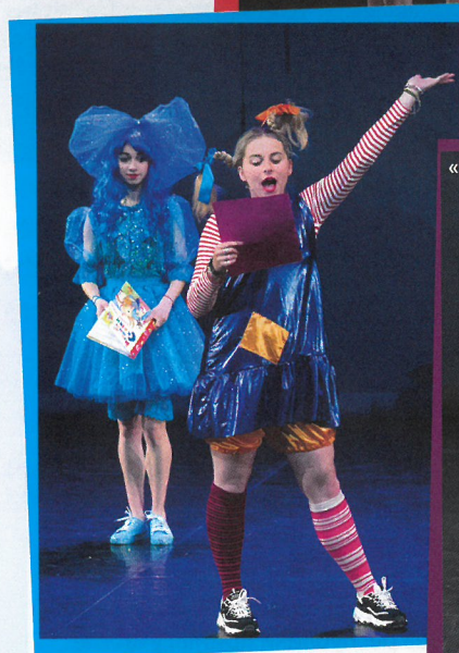
« Aprelik », Paris