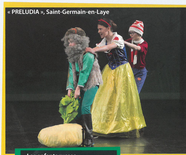
« PRELUDIA », Saint-Germain-en-Laye