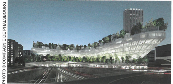
Mille Arbres, Paris

Saint-Augustin, à Paris, le futur siège mondial des Parfums Christian Dior, l'immeuble Kosmo, à Neuilly-sur-Seine, et le « meilleur projet futur » : Mille Arbres, le plus grand pont habité au monde, qui permettra de relier Neuilly et Paris au dessus du périphérique.