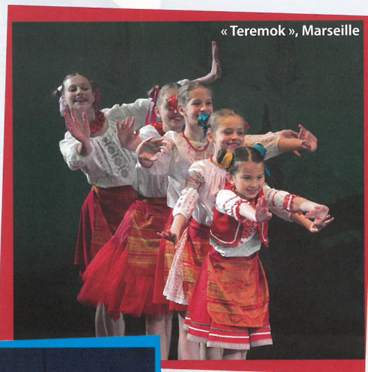
« Teremok », Marseille